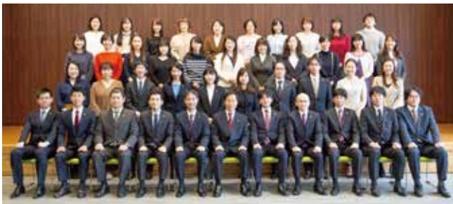
(在籍弁護士17名/2018.11撮影)

当事務所のモットーは、「親切な相談」「適切な解決」です。 大規模事務所の利点を生かすべく、ご依頼につきましては、直接の担当者とともに複数人でチェックできるようにし、難問につきましては、全員で叡智をしばって取り組むようにしております。 弁護士の使命であります、「基本的人権の擁護」「社会正義の実現」（弁護士法1条）の原点に立ち返り、皆さまに信頼される法律事務所たるべく努力します。 トラブルでお困りの人がありましたら、お気軽にご相談下さい。