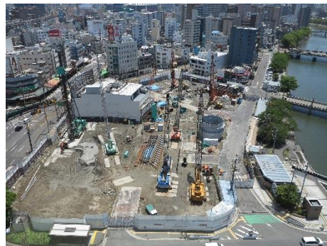
広島駅南口Bブロック

期に建てられた建物にも興味を持っています。広島駅周辺の再開発は停滞していましたが、最近活発に進むようになってきました。写真は広島駅南口Bブロックですが、高層のビルが建つこととなります。古い建物がなくなるのは寂しくもありますが、これにより広島に活気が出てくることを願っています。