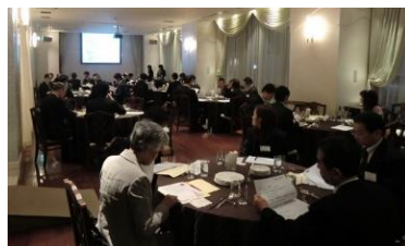
⇨詳細は山下江のブログ 1/26 でも綴っております。