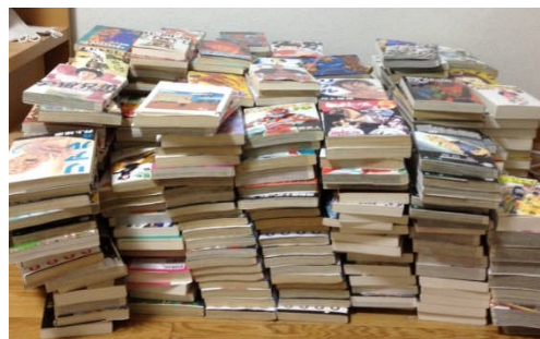
我が家にある漫画

これだけ素晴らしい漫画が数多くある日本に生まれて本当に幸せです。これからも漫画を読む時間を大切にしていきたいと思います。